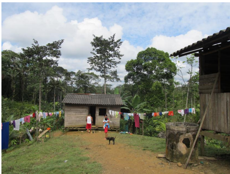
Fotografía del único tanque de recolección de agua lluvia con el que cuenta la comunidad de Ipu Euja

Referirse a saneamiento básico y agua potable dentro de este diagnóstico cobra relevancia, ya que gran parte de los problemas que se presentan en las comunidades en cuanto a la salud surgen por las inadecuadas condiciones en las que se encuentra el agua que consumen los/as habitantes de las comunidades, desde sus costumbres el río es utilizado para lavar la ropa, hacer sus necesidades fisiológicas y a la vez bañarse y utilizar el agua para cocinar, estas son prácticas realizadas a través de lo histórico de estos grupos y es desempeñada por todas las comunidades ya sean indígenas o afros que habitan las riveras, lo que indica que los desechos recorren toda la parte habitada del río, siendo esto un gran agente de contaminación. De igual forma, la situación respecto a lo que tiene que ver con saneamiento es precaria, no existen las adecuaciones sanitarias necesarias, lo cual día tras día también aumenta los focos de contaminación, generando esto grandes problemas de salubridad.